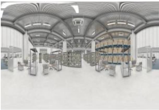
ヴァーチャル内覧動画イメージ