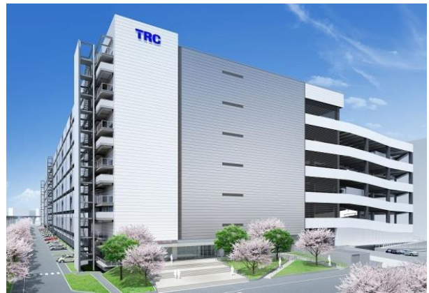
新B棟外観イメージパース