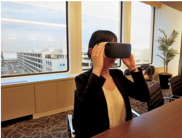
ヴァーチャル内覧