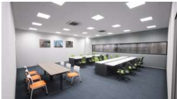
▲モデルルーム内会議室イメージ

当社敷地は東京都心・羽田空港に近接、首都高速羽田線「平和島」出入口まで約1km・湾岸線「大井南」出入口まで約3km、また、JR浜松町駅から東京モノレールで10分の「流通センター」駅徒歩1分と雇用優位性が高く、物流拠点として最適かつ希少な立地です。その立地優位性ととも、物流ビル新A棟で利用可能な最小約145坪～標準約435坪と同様の区画を用意しており、倉庫内にオフィス・会議室などを造作した場合の利用イメージを体感できます。