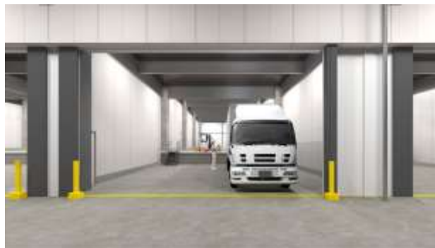
▲バース・倉庫イメージ（中央車路より）